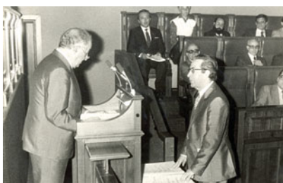
Ante a debilidade con que nacía a Autonomía, os partidos maioritarios ofreceron a algúns galeguistas históricos incluílos nas listas ao Parlamento