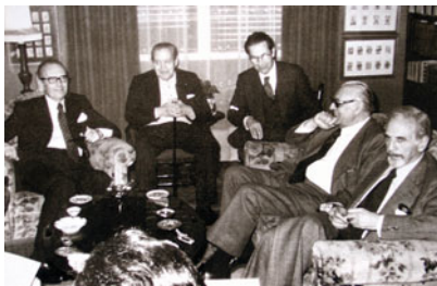
sobranceiros representantes da cultura do exilio (Seoane, Dieste, Blanco Amor...)